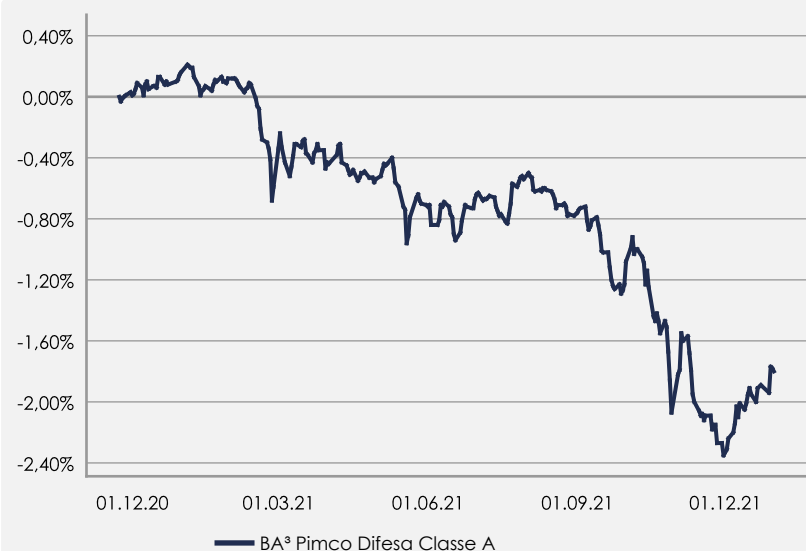
GRAFICO DELLA PERFORMANCE