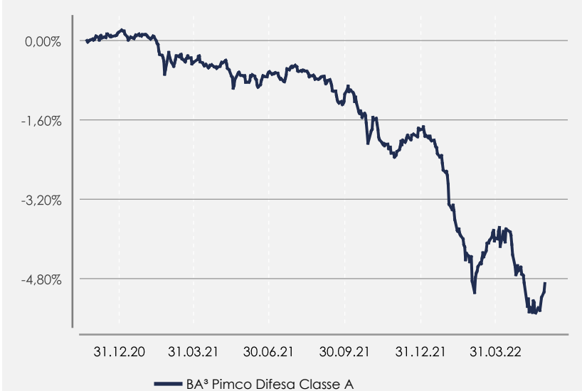
GRAFICO DELLA PERFORMANCE

Il comparto non è gestito con riferimento ad un benchmark.