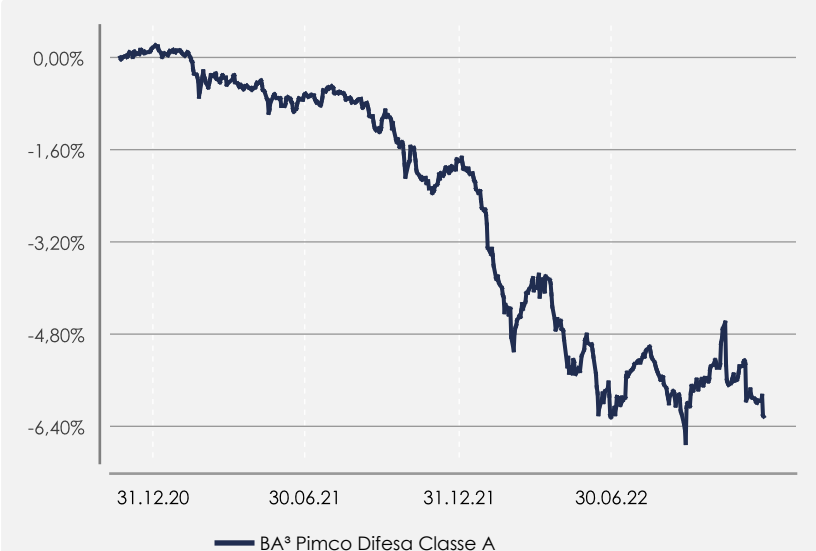
GRAFICO DELLA PERFORMANCE

Il comparto non è gestito con riferimento ad un benchmark.