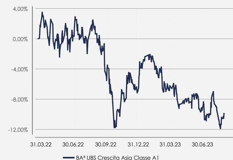
GRAFICO DELLA PERFORMANCE

Il comparto non è gestito con riferimento ad un benchmark.