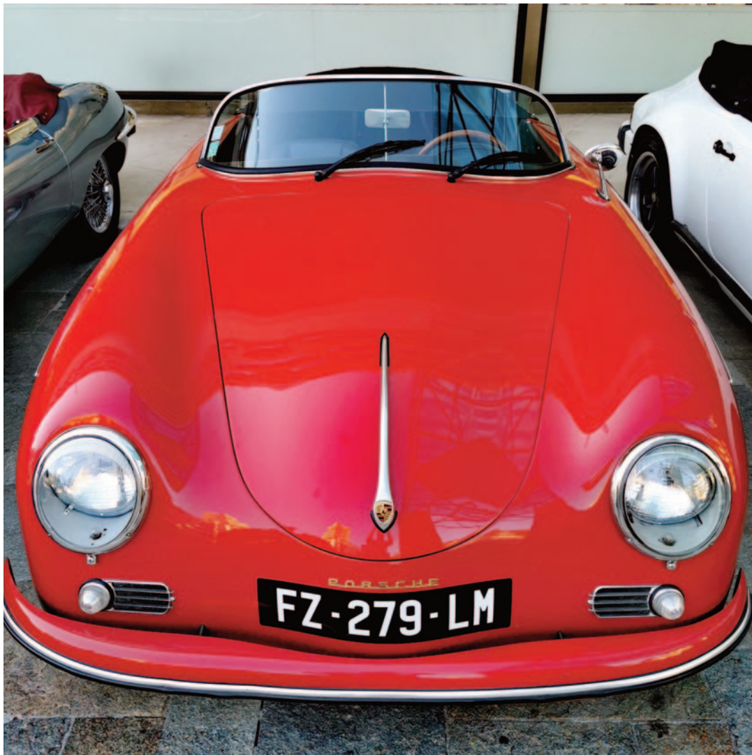
Den Teilnehmern der Banque Havilland (Liechtenstein) AG Classic Car Trophy bot sich in diesem Jahr die einmalige Möglichkeit, mit ihren Oldtimern durch das Fürstentum Monaco zu fahren.

Nach dem Mittagessen, mit atemberaubender Aussicht auf Menton, ging die Tour weiter über die legendäre Grand Corniche. Nicht ohne Grund gilt die ehemalige Römerstrasse zwischen Nizza und Menton als eine der schönsten Panoramastrecken der Welt: In engen Haarnadelkurven führt sie rund 500 Meter über dem Meer vorbei an kleinen Dörfern und hohen Klippen. Sie bietet dabei