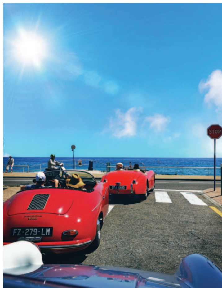
Den Fahrern bot sich eine traumhafte Kulisse.