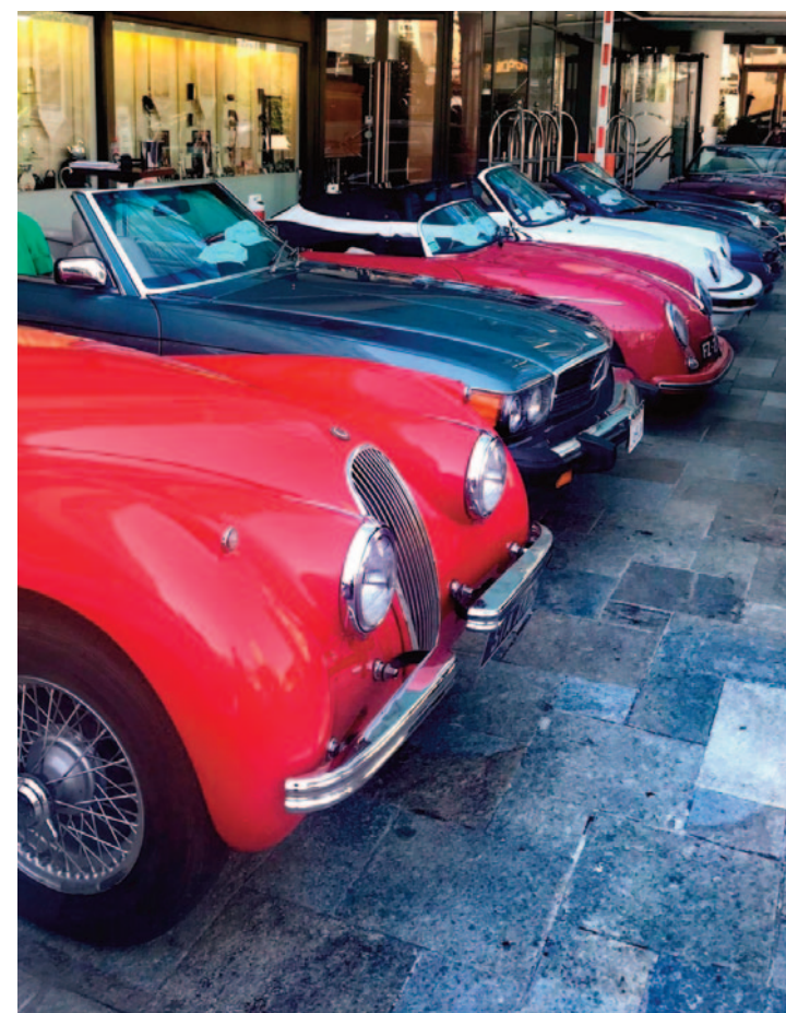
Die Oldtimer vor dem Fairmont Hotel.